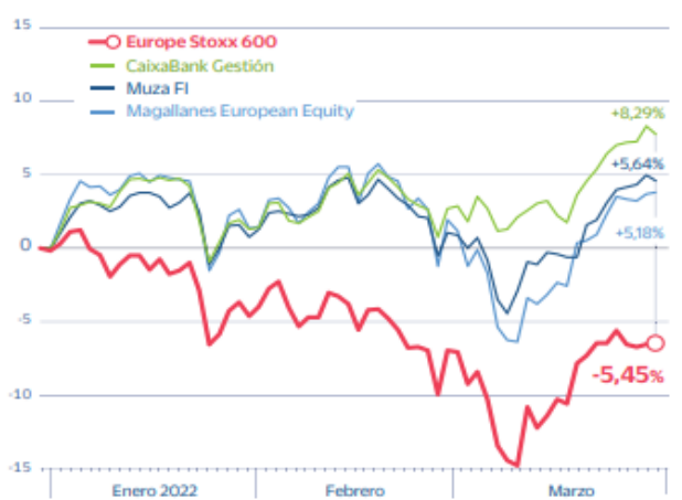
Bolsa europea frente a sus fondos más destacados En % de rentabilidad en 2022*

(*) Hasta el 30 de marzo de 2022.